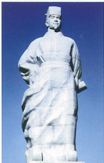
徐福像 连云港市/徐福像 連雲港市

另外，有传说在中国公元前3世纪，秦朝方士徐福曾受秦始皇之命，携3000名童男童女东渡日本寻找长生不老之仙药一事，其中的方士徐福就出生在连云港市，而且传说中的徐福到日本登陆的地点在佐贺县，佐贺县也正是株式会社yamako公司主要加工厂所在地。这些不可思议的“巧合”不得不说是徐福方士牵连起来的缘分。徐福在日本各地传播的农耕医疗等技术及文化，也可以说为日本的发展奠定了基础，所以说日本从中国得到了莫大的恩惠。现在，株式会社yamako在中国发展紫菜事业，虽不比当年徐福之浩大恩德，但即使仅有万分之一的的话，也是报答之意所在。