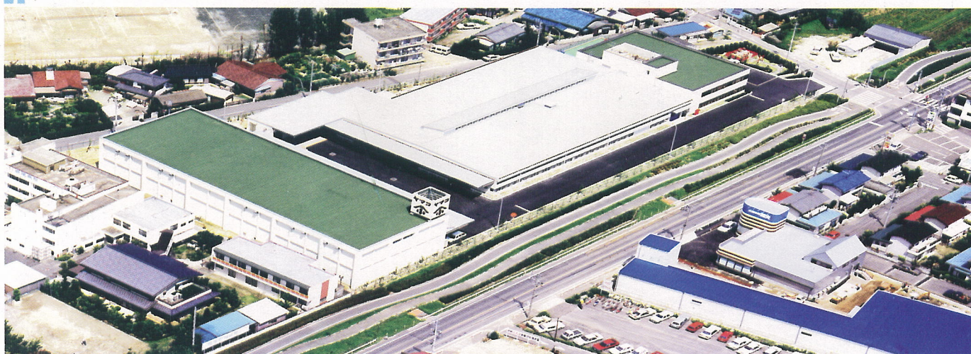
总公司、安城工厂/本社事務所、安城工場

Yamako公司作为世界第一大紫菜加工企业，以它先进的技术赢得了广大用户的信赖，在日本每消费4张紫菜中就有1张是在Yamako公司烘干加工的。