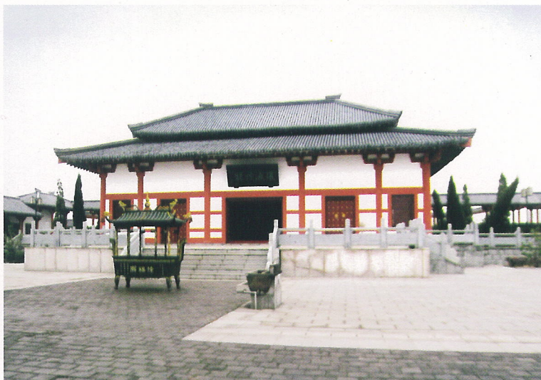
徐福庙 连云港市/徐福廟 連雲港市