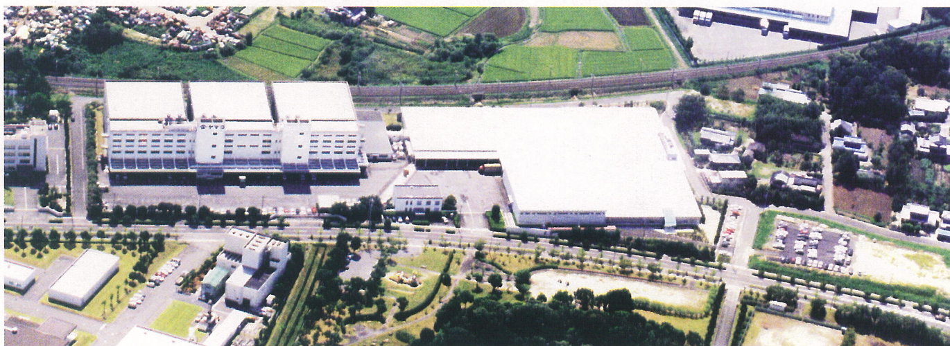
佐贺工厂/佐賀工場

連雲港雅瑪珂に開設した国際海苔取引所は、中国における公正な取引を図り、流通改革による中国海苔産業の発展を実現し、その機能と理念は2003年より江蘇省海苔協会に受け継がれて現在に至っております。