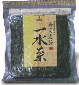
紫菜产品/海苔製品