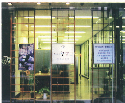
东京分公司/東京支店