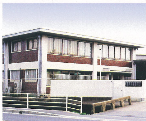
柳川工厂/柳川工場