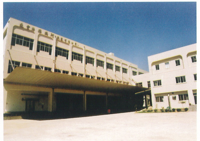
冷冻冷藏仓库/冷凍冷藏倉庫